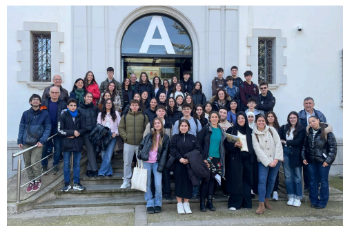
Fotografia grupal a la seu de la UDG (esquerra) i la UDL (dreta)