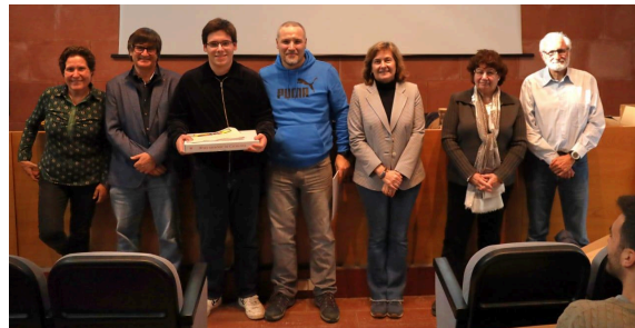
Classificats a la seu de Girona.