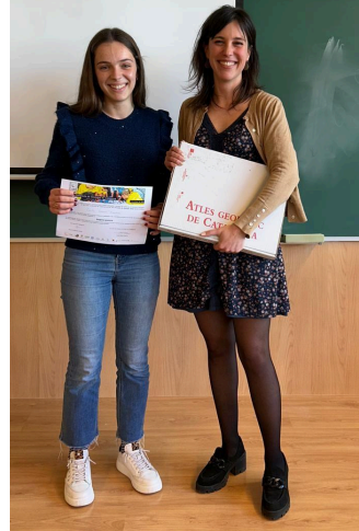
Guanyadors a la seu de Lleida, la UAB i Tarragona.