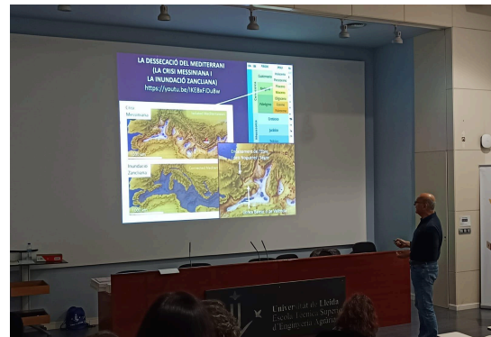
Geogimcana al museu de geologia (esquerra) i xerrada sobre la crisi messiniana a la seu de Lleida (dreta)

Després de la conferència de clausura, s'han donat a conèixer els noms dels guanyadors de l'Olimpíada de Geologia a Catalunya, que representaran el territori en la fase estatal del certamen. A més, han estat obsequiats amb entrades per visitar els dos geoparcs catalans, el Geoparc Orígens i el Geoparc de la Catalunya Central , així com amb exemplars de llibres de l' Institut Cartogràfic i Geològic de Catalunya (ICGC) .