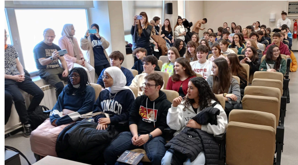
Prova pràctica d'identificació de mostres a la UPC a Manresa (esquerra) i a la mateixa seu esperant l'entrega de premis.

Un cop realitzades les proves, mentre els organitzadors de cada seu corregien el test i la prova pràctica, els participants i els seus professors han assistit a les diferents activitats i xerrades que cada seu ha organitzat.