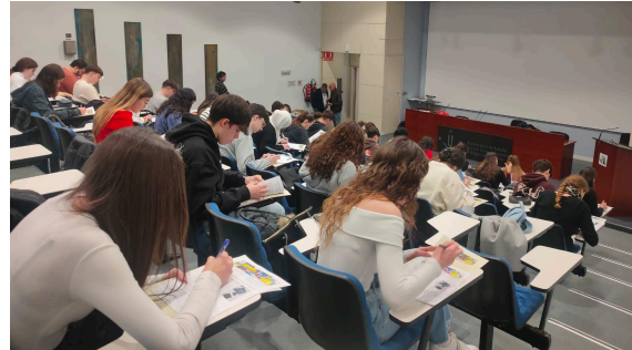
Dinàmiques geològiques a la seu de Tarragona (esquerra) i desenvolupament de la prova teòrica a la Universitat de Lleida (UDL) (dreta).