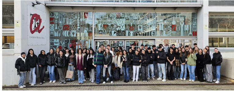
Fotografia grupal a la seu de la URV