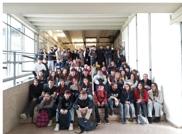
Fotografia grupal a la seu de la UB (esquerra) i la UAB (dreta)